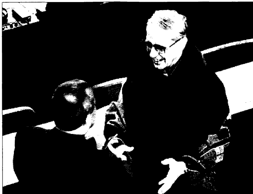
El palentino Adolfo Nicolás en una de las pocas fotos de él que han trascendido.

Desde el momento de su elección, Adolfo Nicolás se ha convertido