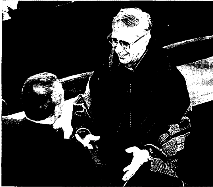
Adolfo Nicolás, nuevo Superior de la Compañía de Jesús.

El Prepósito de los Jesuitas es conocido como el 'Papa negro', debido al gran poder que esta orden ha tenido siempre en la Iglesia católica y a su hábito de