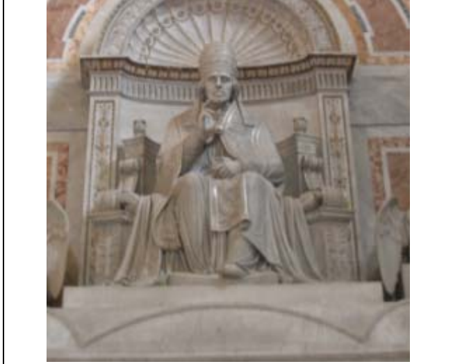
Restauración de la Compañía 1814. Monumento funerario de Pío VII en la basílica San Pedro del Vaticano