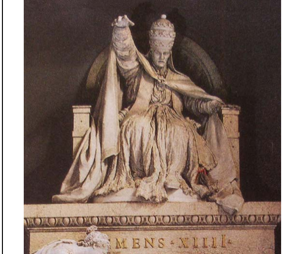
Supresión de la Compañía 1773. Monumento funerario de Clemente XVI en la basílica de los Santos Apóstoles